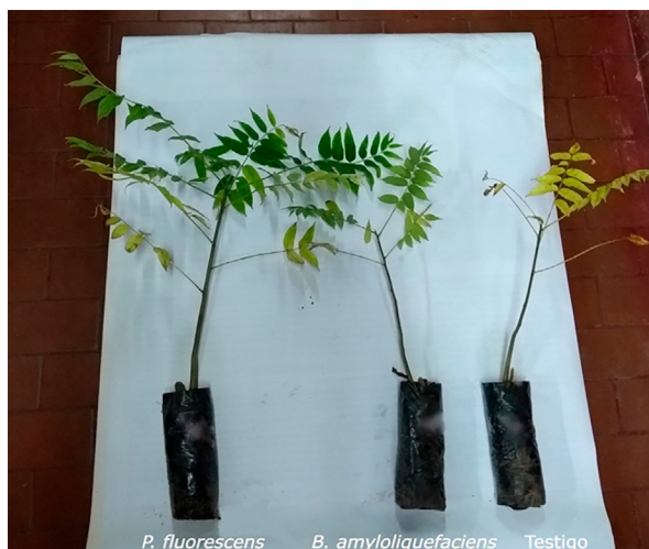
Figura 2. Plantines tipo representativos de los tres tratamientos.

Para fortalecer al plantín de Cedrela fissilis , puede recurrirse a su inoculación con bacterias, tales como Pseudomonas fluorescens , dada la estimulación del crecimiento vegetal que se observa con su aplicación. Esto demuestra el potencial que tienen estos microorganismos como promotores del crecimiento de esta especie forestal vegetal, además de sugerir que es posible su uso como biofertilizantes.